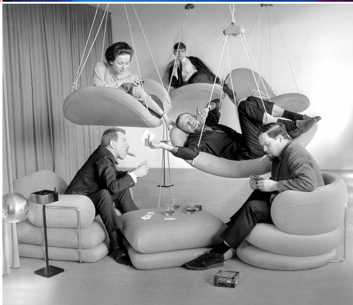
Fotos: Fritz Reiss/Picture Alliance via Getty Images (Living Tower), Ohh!!!/Unsplash (restaurante da editora da revista alemã Der Spiegel), Roland Witschel/Picture Alliance via Getty Images (Flying Chairs) e divulgação