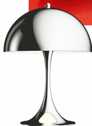
À esq., luminária Panthella, lançada pela Louis Poulsen em 1971 e produzida até hoje; acima, detalhe do assento-escultura Living Tower, de 1968; no alto, o Multifunctional Living Unit, de 1966; acima, à dir., instalação Visiona 2 (1970), que dissolveu os limites entre mobiliário e arquitetura; e, à dir., as Flying Chairs, de 1964. Na pág. seguinte, luminária Moon e cadeiras System 1-2-3

Sua última grande instalação, Light and Color (1998), no Trapholt Museum for Modern Art and Design, em Kolding, Dinamarca, conduzia o visitante por oito salas monocromáticas, cada uma explorando o impacto físico e emocional da cor. Um desfecho coerente para quem passou a vida combatendo a “conformidade branco e bege”, como gostava de dizer.